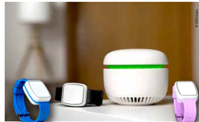
Hausnotruf neu gedacht. CARU care bietet wichtige Zusatzfunktionen, passt optisch gut in jeden Raum und an Ihr Handgelenk.

Die Kosten für das Komfort-PLUS-Paket betragen € 73,30 monatlich. Bei einem anerkannten Pflegegrad übernimmt die Pflegeversicherung in der Regel den Anteil in Höhe von monatlich € 25,50.