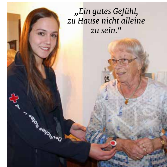
Stand: Januar 2021