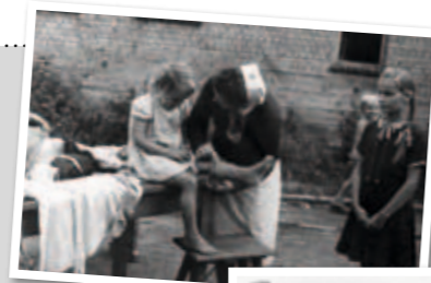
Rotkreuzschwestern kümmern sich um Kinder aus Vertriebenenfamilien um 1950