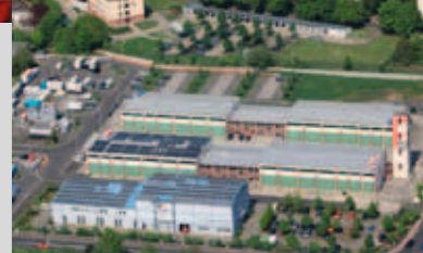
Rotkreuzhaus mit Gefahrenabwehrzentrum 2008