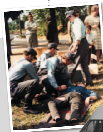
Übung des Kreisverbandes Gelnhausen 1970