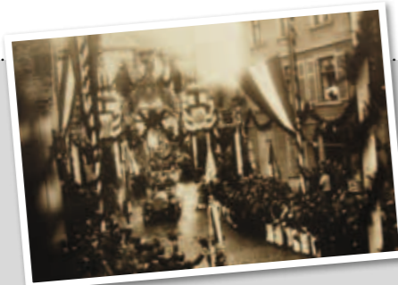
Kaiser Wilhelm II durchfährt im Automobil den Triumphbogen am Ziegelhaus. Die Kolonnenmitglieder stellten Sanitätsposten 1906