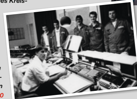
Die Leitstelle des Kreisverbandes befand sich im Pförtnerhäuschen des Kreiskrankenhauses Gelnhausen 1990