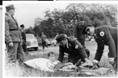
Großübung auf der Müllerwiese 1969