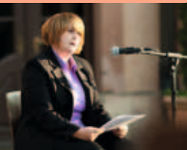
Präsentation der Chronik im Schlosshof Birstein

Bei allen Präsentationen der Chronik rief der Kreisverband zu Spenden für die Flutopfer in Pakistan auf. So kamen insgesamt 900 Euro für die Menschen in Pakistan zusammen. 09/10 ■