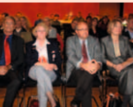
Feierstunde im Main-Kinzig-Forum