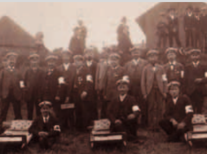
Die Aktiven der Freiwilligen Sanitätskolonne vom Roten Kreuz Gelnhausen während einer Bezirksübung in Fulda 1904