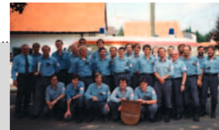
Schnelleinsatzzug des Kreisverbandes 1984