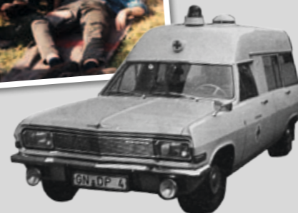
Opel Admiral-Krankenwagen des KV Gelnhausen 1979