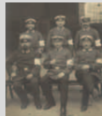
Mitglieder der Freiwilligen Sanitätskolonne 1925